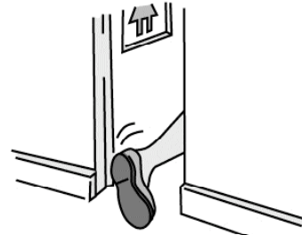
MADALAS NA PAG-IHI