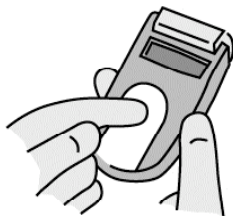
SURIIN ANG ASUKAL NG DUGO